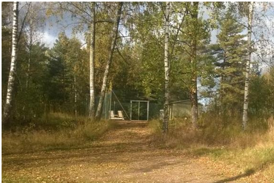
Kuva 5. Tenniskentän porttia kohti.