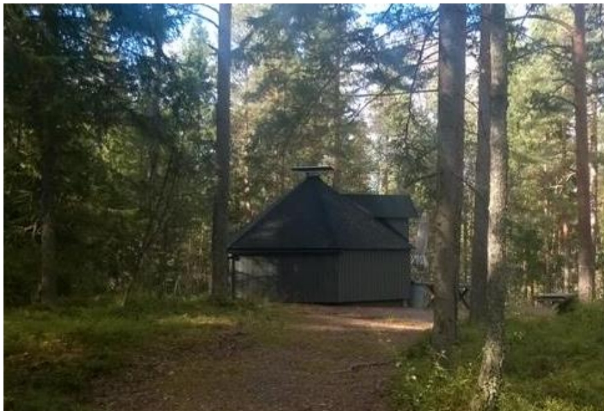
Kuva 3. Grillipaikka.