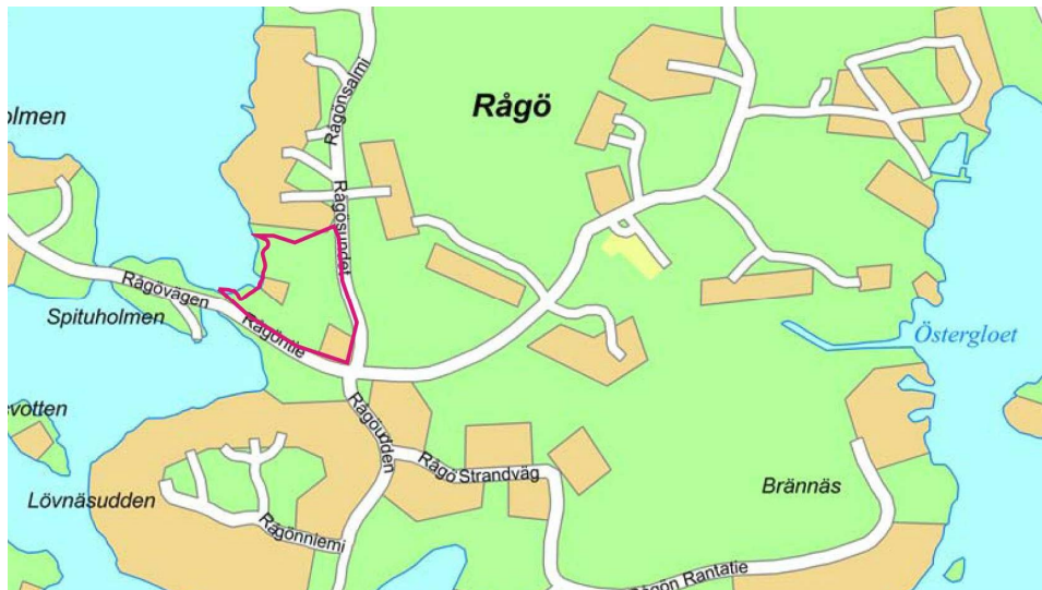
Suunnittelualue merkitty punaisella viivalla

Kaava-alue sijaitsee Tammisaaren saaristossa Rågön saaren länsirannalla. Alue käsittää Rågön kylässä olevan tilana RN:o 4:81 (710-443-4-81) sekä osan tilasta 4:137 (710-443-4-137). Kaava-alueen koko on noin 2,4 ha.