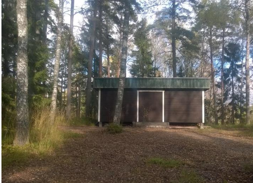
Kuva 2. Nykyinen huoltorakennus.

Suunnittelualueen lähialue on valtaosin rakennettu voimassa olevan ranta-asemakaavan mukaisesti. Rantaan ulottuvalla yhteiskäyttöalueella on sauna ja laituri ja vähän kauempana rannasta on tenniskenttä. Korttelialueelle on rakennettu noin 42 k-m 2 kokoinen huoltorakennus. Saunan läheisyyteen on rakennettu osittain katettu grillipaikka. Huoltorakennus ja grillipaikka puretaan kaavamuutoksen ja loma-asuntojen rakentamisen yhteydessä. Alueen ulkopuolella, kaakkoskulmassa olevan tienristeyksen toisella puolella, sijaitsee alueen jätekontti.