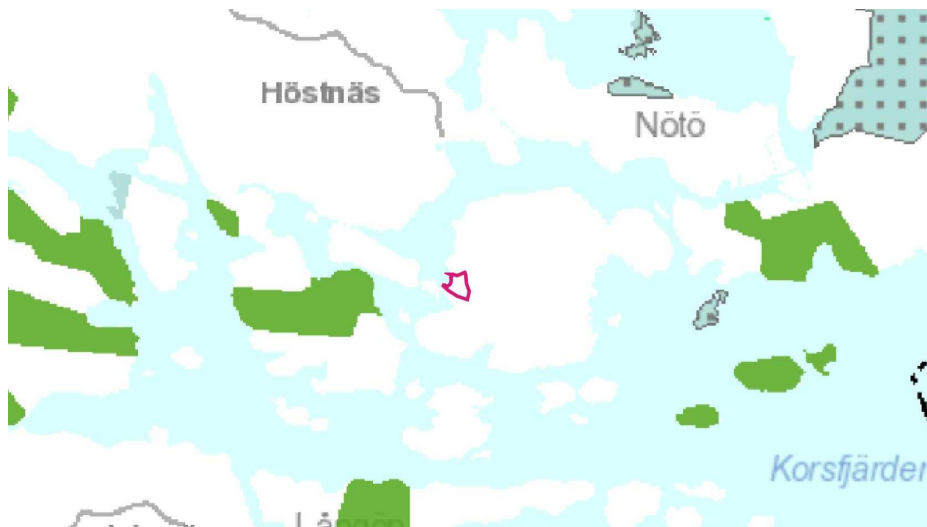
Ote Uudenmaan vahvistettujen maakuntakaavojen yhdistelmästä 2014, 1-3. vaihekaava. Suunnittelualue merkitty punaisella viivalla.

Uudenmaan neljännen vaihemaakuntakaavan valmistelu on käynnissä. Kaavan tavoitteena on tukea kestäväää kilpailukykyä ja hyvinvointia Uudellamaalla. Neljäs vaihekaava tulee olemaan aiempia maakuntakaavoja strategisempi. Käsiteltäviä aihealueita ovat elinkeinot ja innovaatiotoiminta, logistiikka, tuulivoima, viherrakennus ja kulttuuriympäristöt. Luonnos vaihekaavasta on ollut nähtävillä vuoden 2015 alussa.