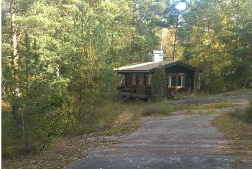
Kuva 4. Yhteissaunarakennus.