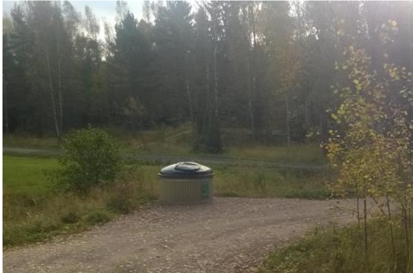
Kuva 6. Alueen jäteastia tien toisella puolella.